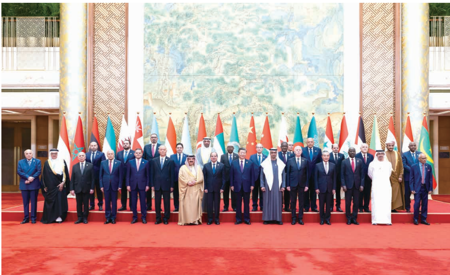
5月30日上午，国家主席习近平在北京钓鱼台国宾馆出席中阿合作论坛第十届部长级会议开幕式并发表主旨讲话。这是习近平同巴林国王哈马德、埃及总统塞西、突尼斯总统赛义德、阿联酋总统穆罕默德、阿盟秘书长盖特以及22位阿拉伯国家代表团团长集体合影。