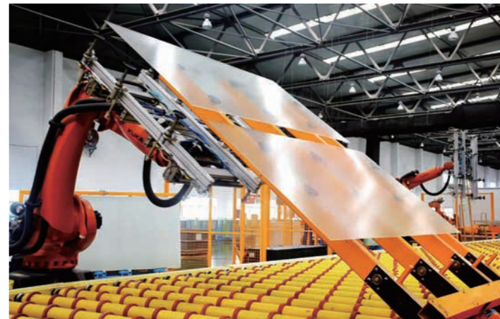
彩虹光伏玻璃生产线