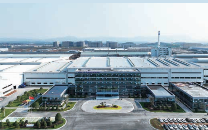
彩虹上饶产业基地

彩虹集团有限公司(以下简称“彩虹集团”),属国家“六五”重大建设项目,是中国首家从事彩色显像管及其玻壳、荧光材料等全套零部件配套的企业,于1982年建成投产,曾相继创造出多个“中国第一”,为中国显示工业的振兴作出了巨大贡献。随着新型显示的迅速崛起,为进一步整合资源,确保企业稳定健康持续发展,2012年12月31日,国务院国资委决定,彩虹集团整体并入中国电子信息产业集团有限公司(以下简称“中国电子”)。近年来,彩虹集团以“为国家提供战略性先进材料产品及解决方案”为核心使命,聚焦“223”战略,深耕电子玻璃、光伏玻璃等核心产业,企业进入高质量发展新阶段。