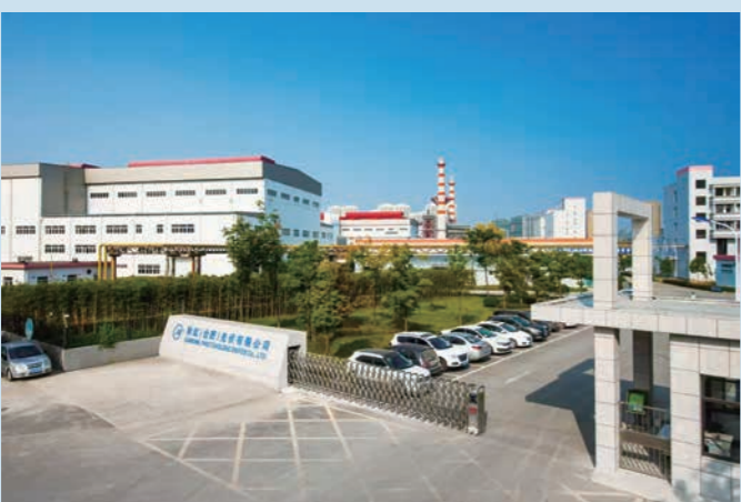
彩虹合肥产业基地

去年以来,彩虹集团坚持以习近平新时代中国特色社会主义思想为指导,聚焦中国电子打造国家网信事业核心战略科技力量的总体布局,按照“重塑价值体系、