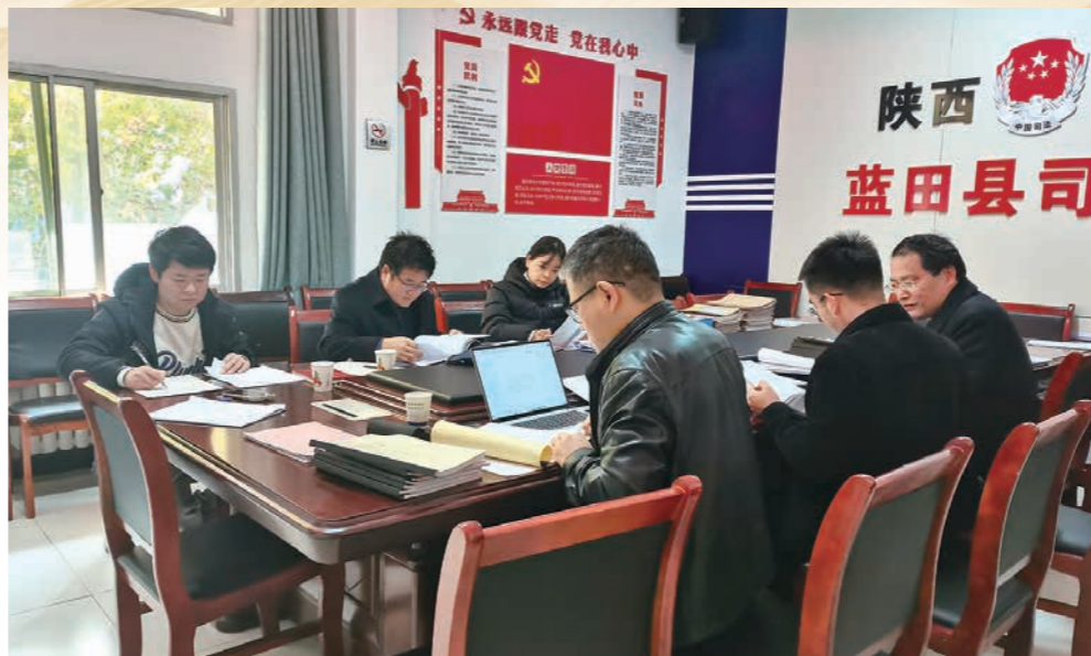
对全县各行政执法单位开展执法案卷评查工作

法治是最好的营商环境。2023年，蓝田县司法局紧扣全省“营商环境突破年”主题和西安市八个方面重点工作，出台《推进营商环境突破年“18+4”系列方案》，并印发《法治化营商环境突破提升方案》等系列方案，研究制定营商环境专项治理、政策兑现清障行动等10多项配套举措，集中力量落实改革任务、补齐短板弱项、破解难题瓶颈、提升服务效能。建立重点项目、重大工程法律服务