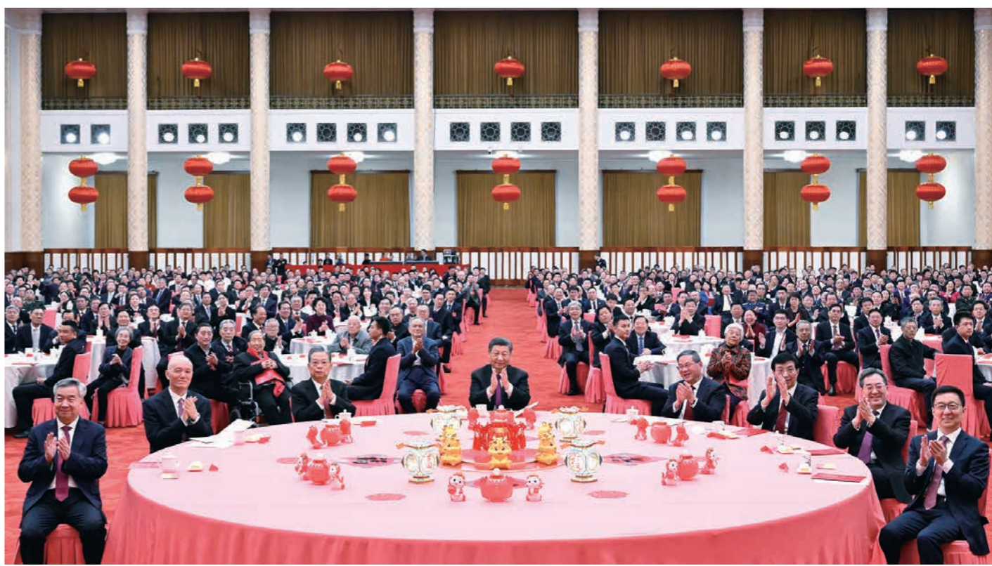
2月8日,中共中央、国务院在北京人民大会堂举行2024年春节团拜会。党和国家领导人习近平、李强、赵乐际、王沪宁、蔡奇、丁薛祥、李希、韩正等同首都各界人士齐聚一堂、共迎新春。