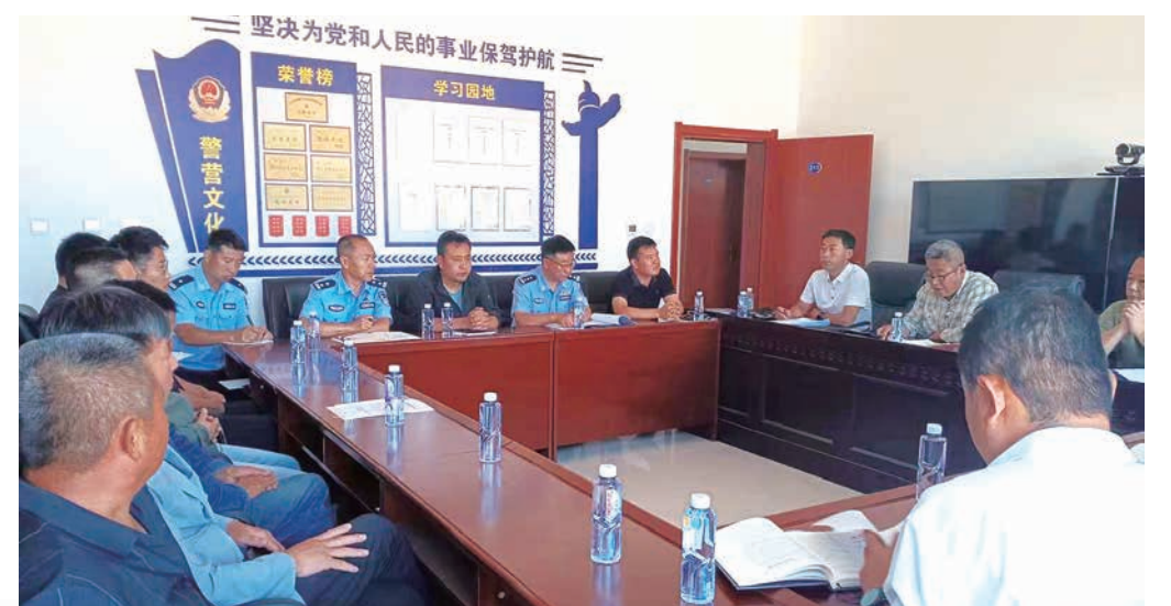
靖边县政协组织委员民主评议县公安局工作