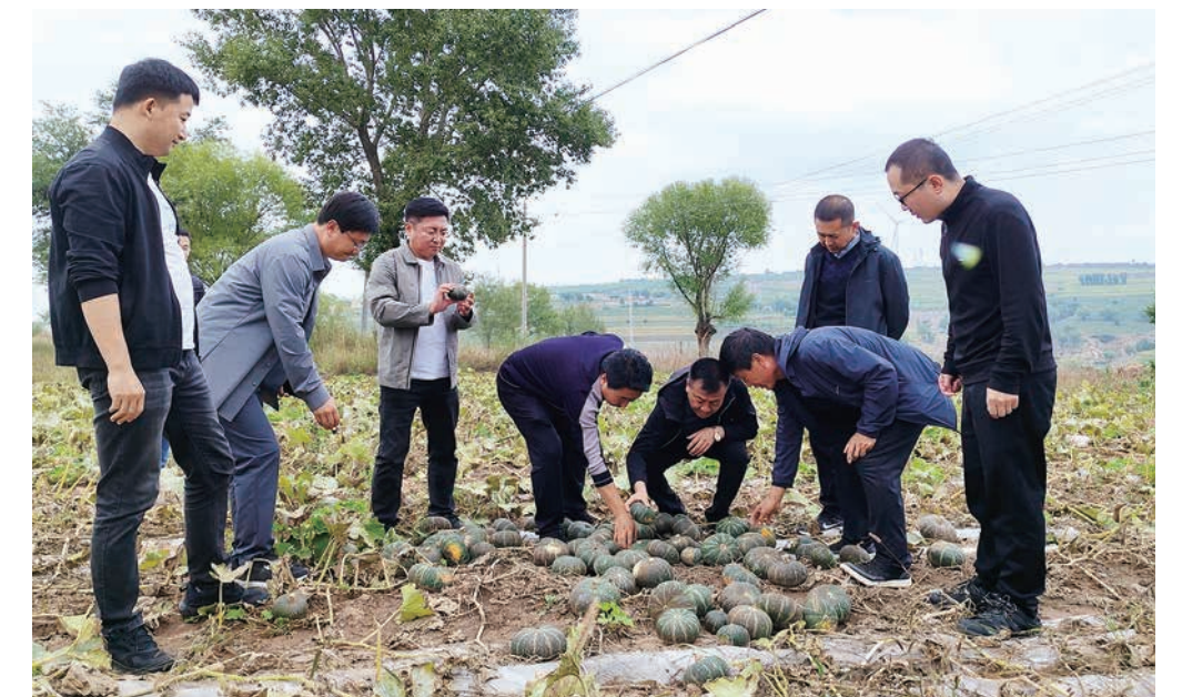
靖边县政协组织机关干部到包抓的席麻湾镇小沙柳村了解帮扶情况