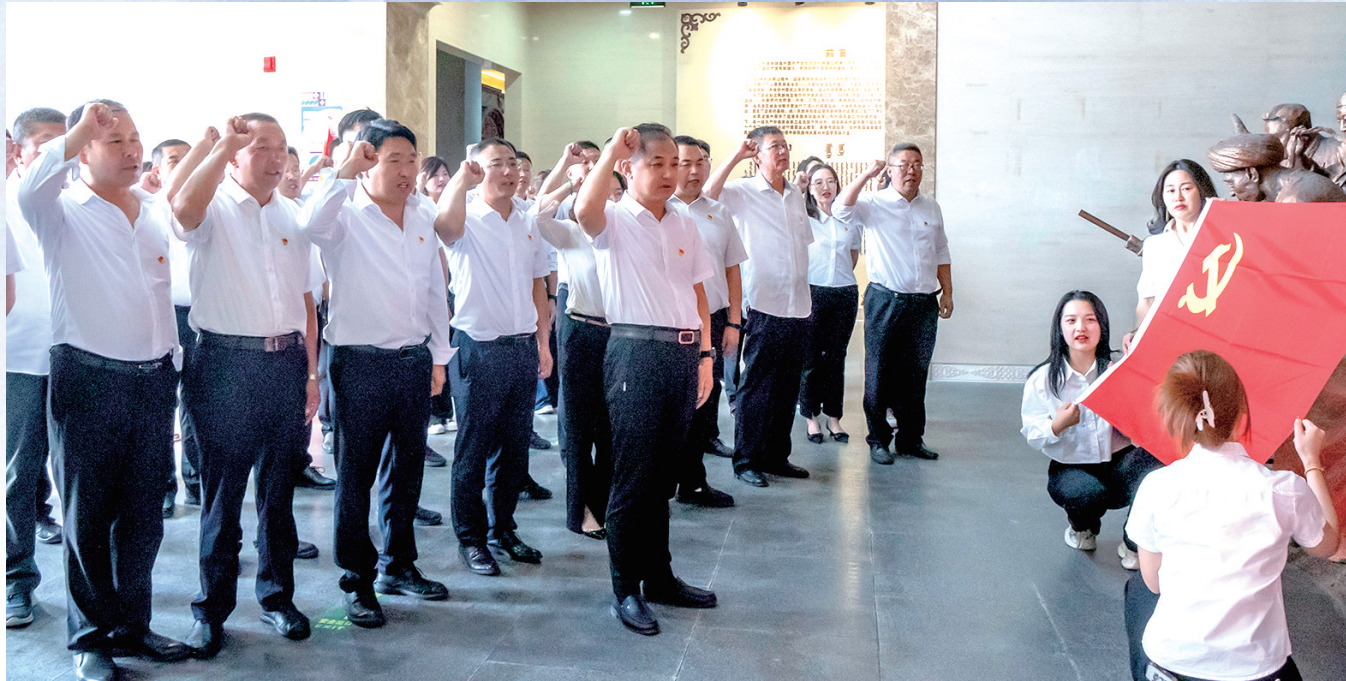
2023年7月5日，靖边县政协开展党组书记讲党课暨党员集体政治生日活动。

围绕“林场管理”“煤矿建设及企业发展”“生态工业园区建设”“地下水超采治理”“新能源产业发展”“红色革命历史文化资源保护利用”等开展省市县联动协商9次，征集、报送34大项、71条具体意见建议……2023年，靖边县政协及其常委会充分发挥专门协商机构作用，坚持建言资政和凝聚共识双向发力，稳步推进书香政协、有为政协、活力政协、务实政协建设，积极建言资政，倾力服务发展，为全县经济社会高质量发展贡献了智慧和力量。