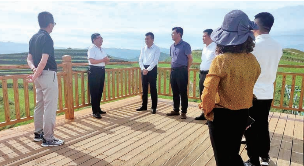
靖边县政协组织部分委员赴甘肃调研中药材产业发展情况