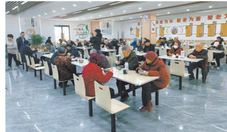
开在家门口的金阳社区幸福食堂