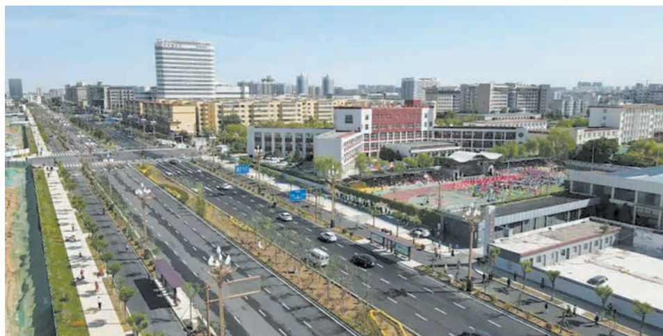
织密路网、加速铺就发展“快车道”。2023年6月5日,榆林城区1393米的文化南路(榆阳路至人民路)拓宽改造工程竣工通车。