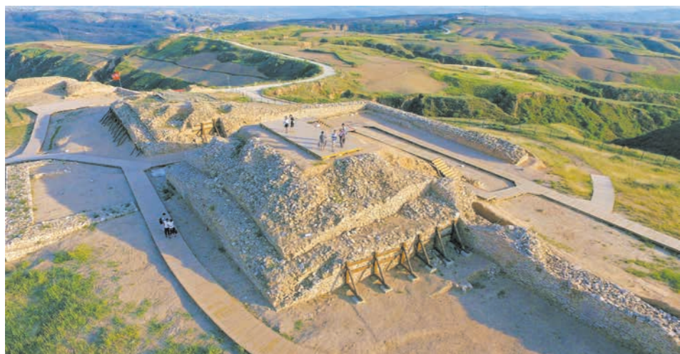
2023年4月18日,第41个国际古迹遗址日当天,在国家考古遗址公园现场工作会上,神木石峁遗址被正式授牌第四批国家考古遗址公园。