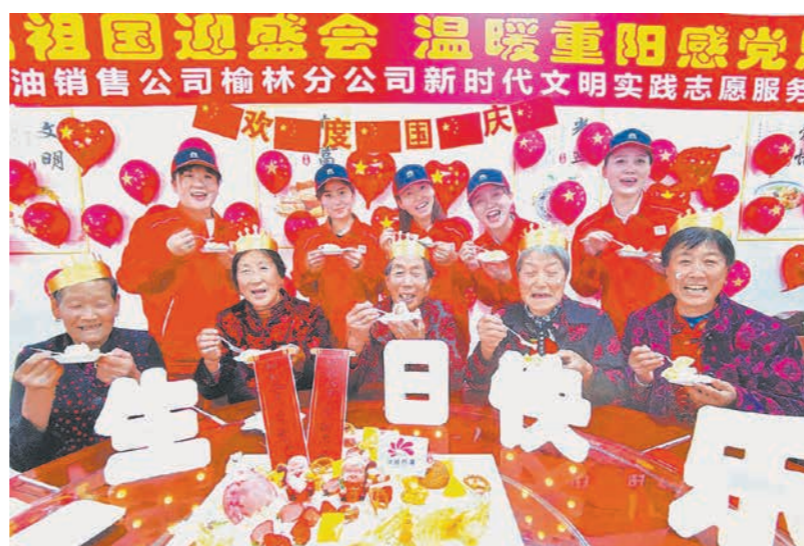
志愿者为老人集体过生日