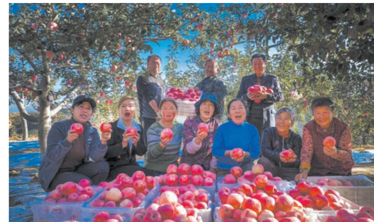
榆林紧抓全省苹果“北扩西进”战略机遇,把发展山地苹果作为百亿级农业主导产业来打造,力促山地苹果成为群众的“致富果”“希望果”。