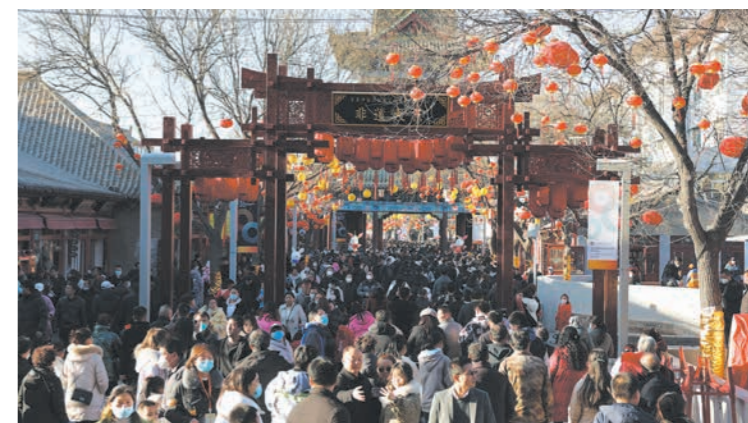
2023年2月16日至20日,首届中国非遗保护年会在榆林举行。