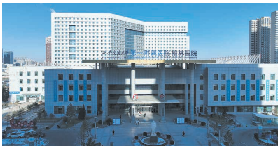
2023年12月23日,第五批国家区域医疗中心项目之一的西安交通大学第一附属医院榆林医院正式揭牌开诊,将为辐射区内约2000万人提供优质高效的医疗健康服务。