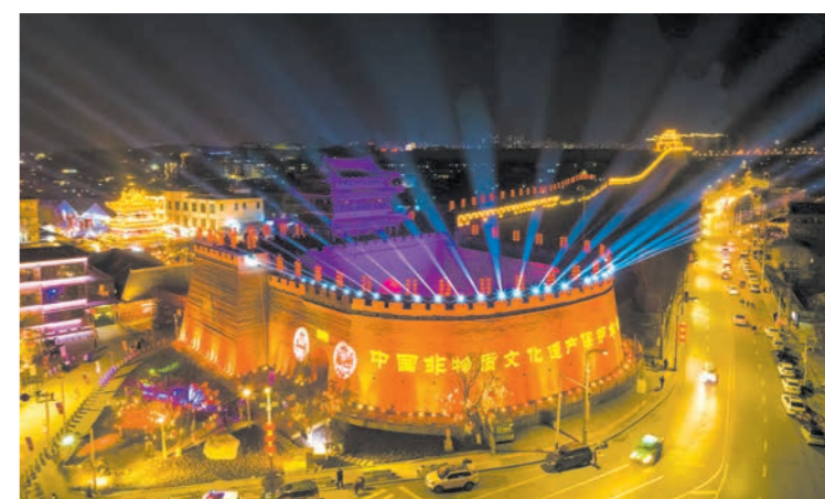
“陕北榆林过大年”——浓浓的陕北民俗年味引来四方游客

在奋力拼搏中,看时代发展浪潮;于朝夕变化里,期冀一座城市的明天。开局之年的“榆林答卷”格外精彩,不觉间,活力之城的宏伟蓝图正在一步步落笔。立足新起点,榆林市将以更加昂扬的态度,乘风破浪、奋楫前行,谱写高质量发展新篇章。