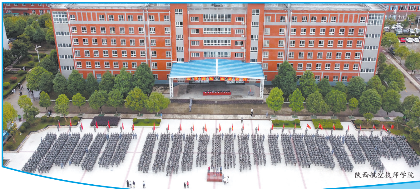
陕西航空技师学院