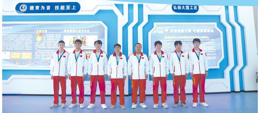
2023年第二届全国职业技能大赛，来自西安建筑工程技师学院的8名选手荣获全国优胜奖。

踔厉奋发七十载，笃行不怠启新程。陕西技工教育坚守技工教育初心，践行立德树人使命，担当在肩、理想在前，深入钻研、勇于创新，在中华民族伟大复兴的新征程上，在陕西高质量发展的社会进程中，必将更加坚定地承担起锻造大国工匠、奠基陕西制造的职责，更加有力地肩负起技能强国、职教兴邦的历史重任。