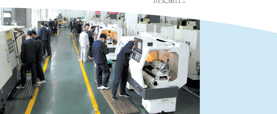
西安技师学院的学生在数控车间里实践