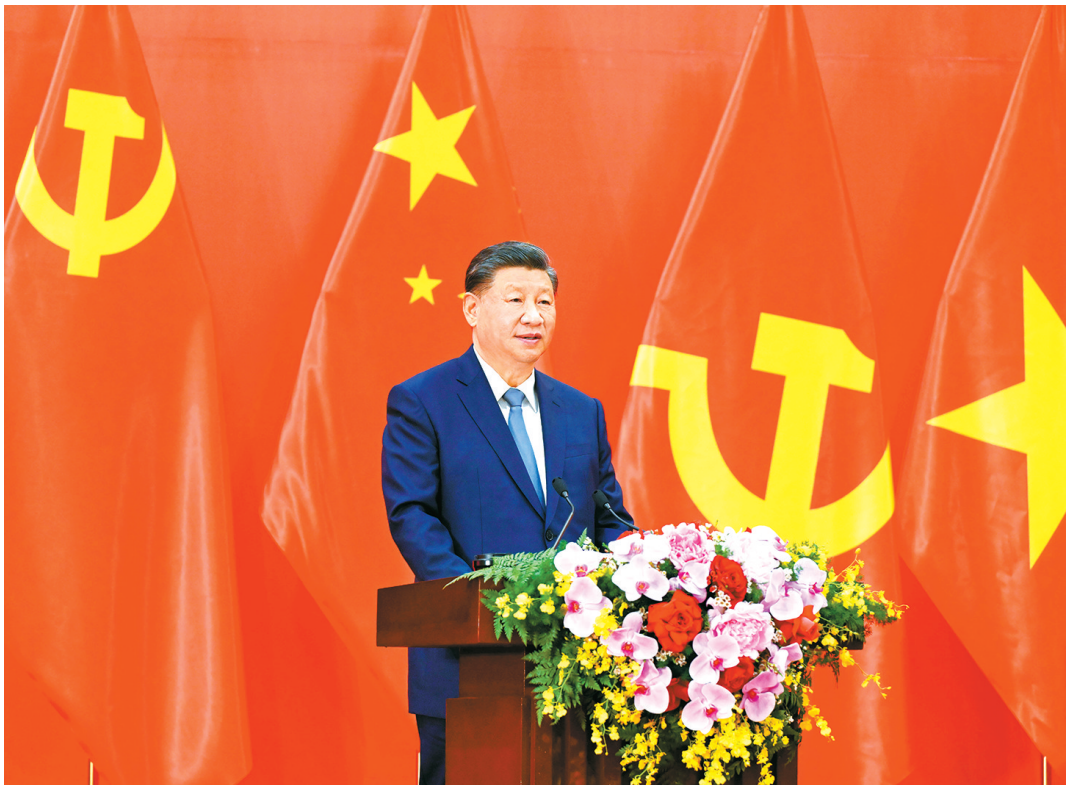
当地时间十二月十三日下午,中共中央总书记、国家主席习近平和夫人彭丽媛在河内同越共中央总书记阮富仲夫妇共同会见中越两国青年和友好人士代表。这是习近平发表题为《赓续传统友谊,开创中越命运共同体建设新征程》的重要讲话。

新华社河内12月13日电(记者倪四义 宿亮 孙一)当地时间12月13日下午,中共中央总书记、国家主席习近平和夫人彭丽媛在河内同越共中央总书记阮富仲夫妇共同会见中越两国青年和友好人士代表。