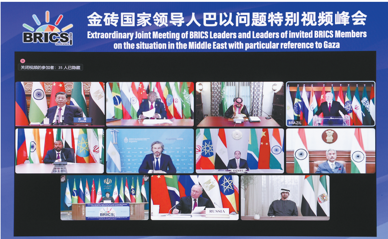
11月21日晚,国家主席习近平出席金砖国家领导人巴以问题特别视频峰会并发表题为《推动停火止战 实现持久和平安全》的重要讲话。

新华社北京11月21日电 11月21日晚,国家主席习近平出席金砖国家领导人巴以问题特别视频峰会并发表题为《推动停火止战 实现持久和平安全》的重要讲话。 习近平指出,本次峰会是金砖扩员后的首场领导人会晤。当前形势下,金砖国家就巴以问题发出正义之声、和平之声,非常及时、非常必要。加沙地区的冲突已持续一个多月,造成大量平民伤亡和人道主义灾难,并出现扩大外溢趋势,中方深表关切。当务之急,一是冲突各方要立即停火止战,停止一切针对平民的暴力和袭击,释放被扣押平民,避免更为严重的生灵涂炭。二是要保障人道主义救援通道安全畅通,向加沙民众提供更多人道