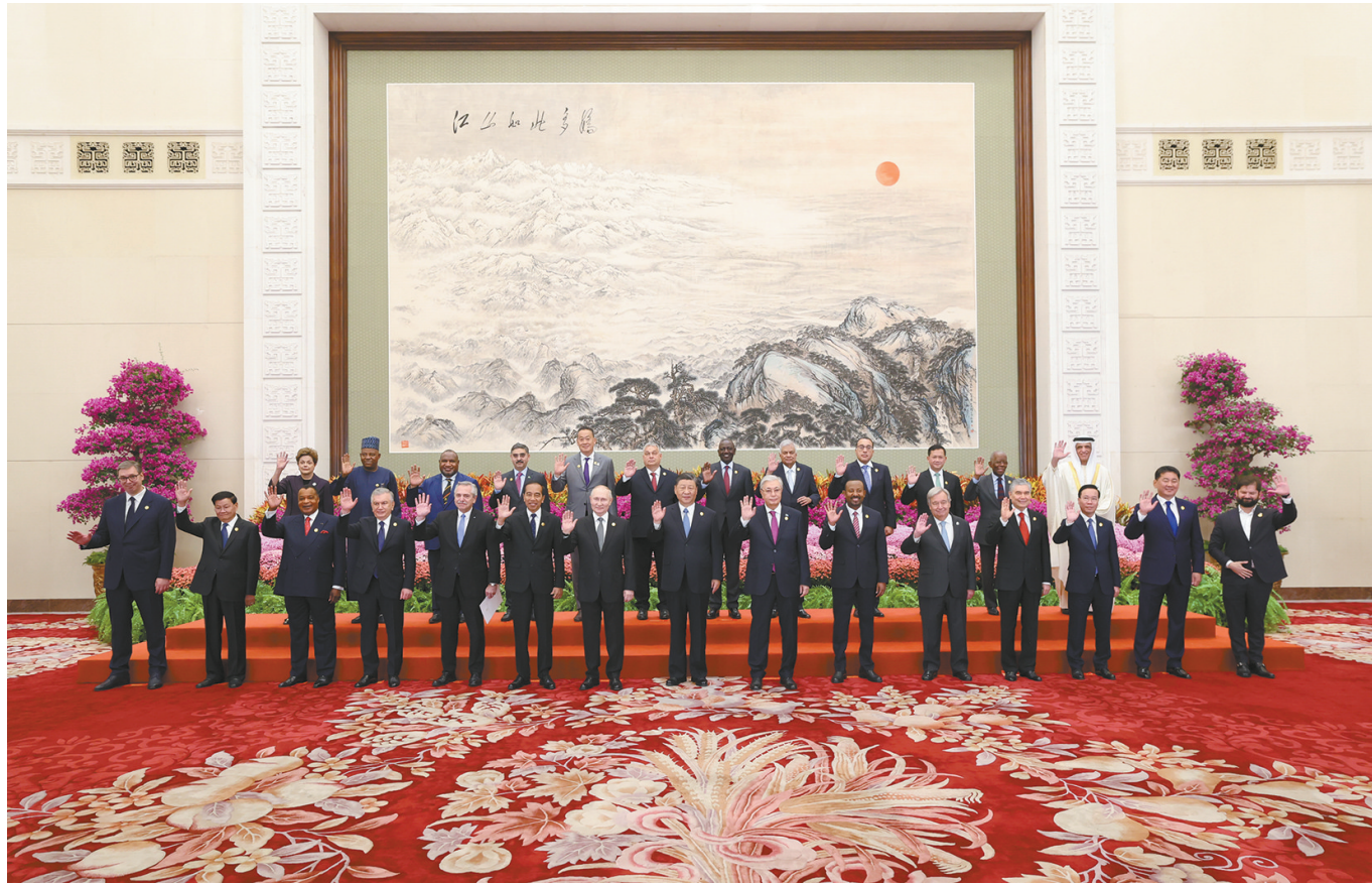
10月18日上午，国家主席习近平在北京人民大会堂出席第三届“一带一路”国际合作高峰论坛开幕式并发表题为《建设开放包容、互联互通、共同发展的世界》的主旨演讲。这是会前，习近平同出席高峰论坛的外国国家元首、政府首脑和国际组织负责人等国际贵宾集体合影。