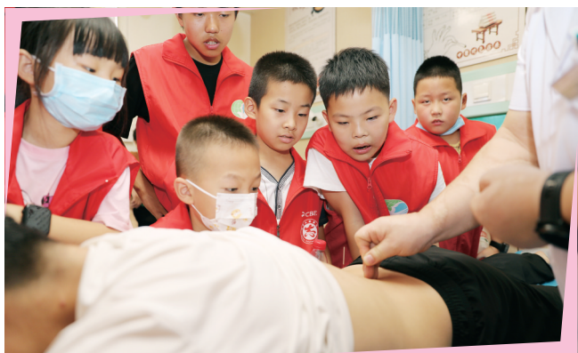
“医二代”们正在观摩针灸治疗