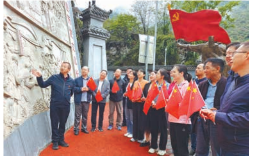
国庆节前夕的红色教育活动