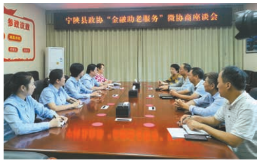
“金融助老服务”微协商