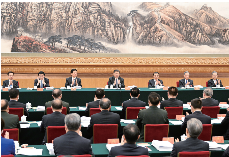
10月18日,中国共产党第二十次全国代表大会主席团在北京人民大会堂举行第二次会议。习近平、李克强、栗战书、汪洋、王沪宁、赵乐际、韩正等出席会议。